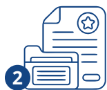
2 Подготовка документов