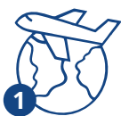
1 Прибытие в Россию

Патент на работу имеет ограниченный срок действия до 12 месяцев. Оплата производится за каждый месяц действия патента. Если не оплатить патент вовремя – он перестанет действовать!