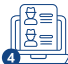
4 Подача документов