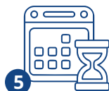
5 Получение патента