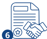
6 Приём на работу

Срок подачи документов на патент – 30 дней с момента въезда в Россию (22 дня если вы подаете документы через уполномоченную организацию).