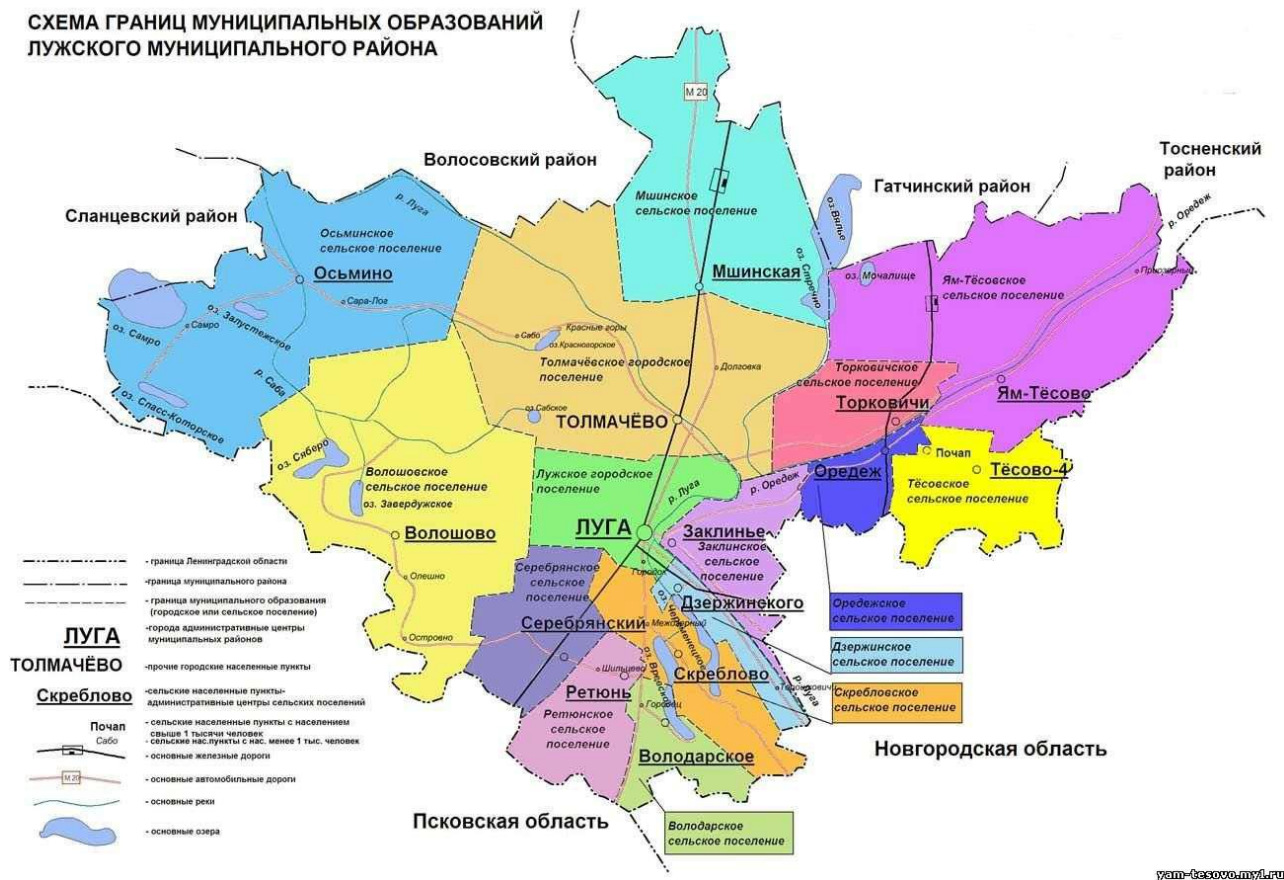
Рис. 1 Границы муниципальных образований Лужского муниципального района

Границы Серебрянского сельского поселения представлены на рис. 1.