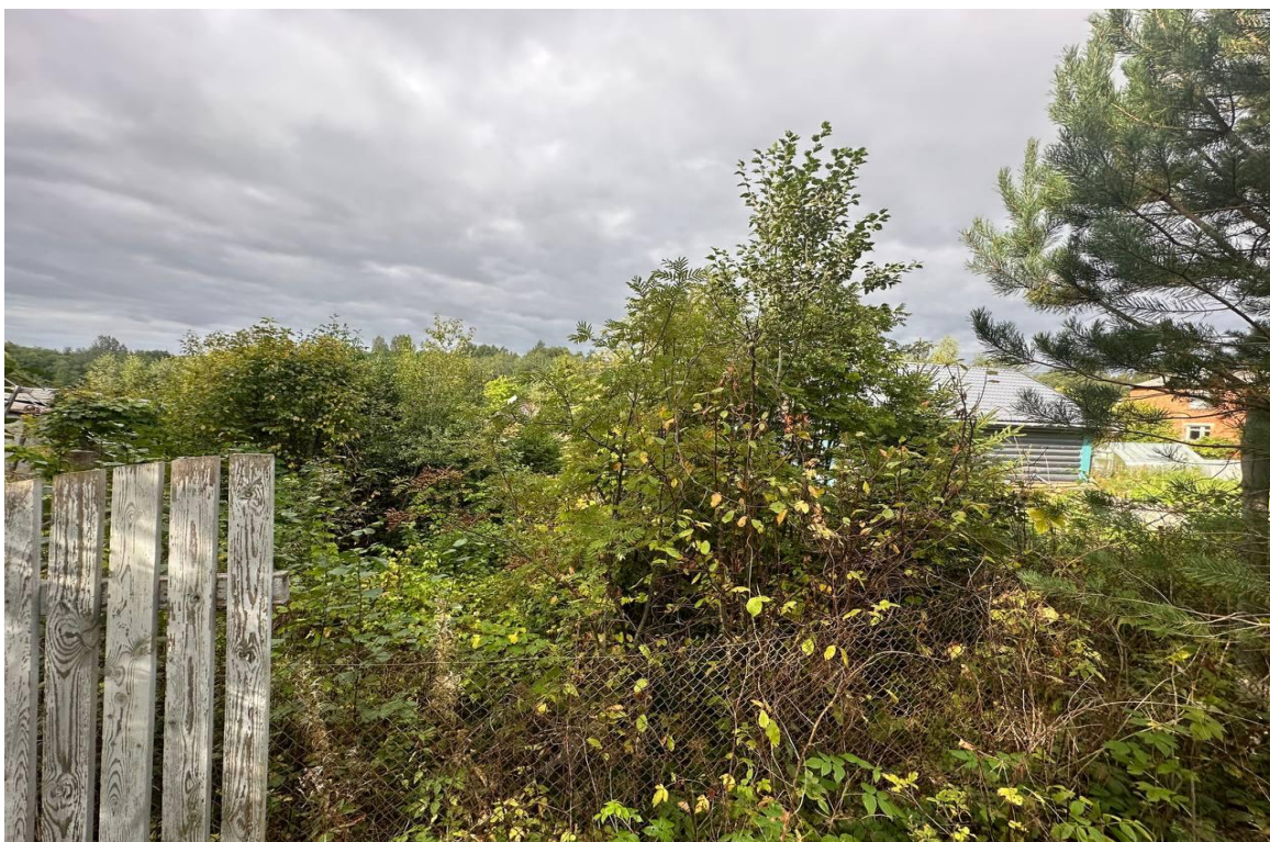
Фото № 2. Ограждение со стороны земельного участка с КН 47:29:0715001:71