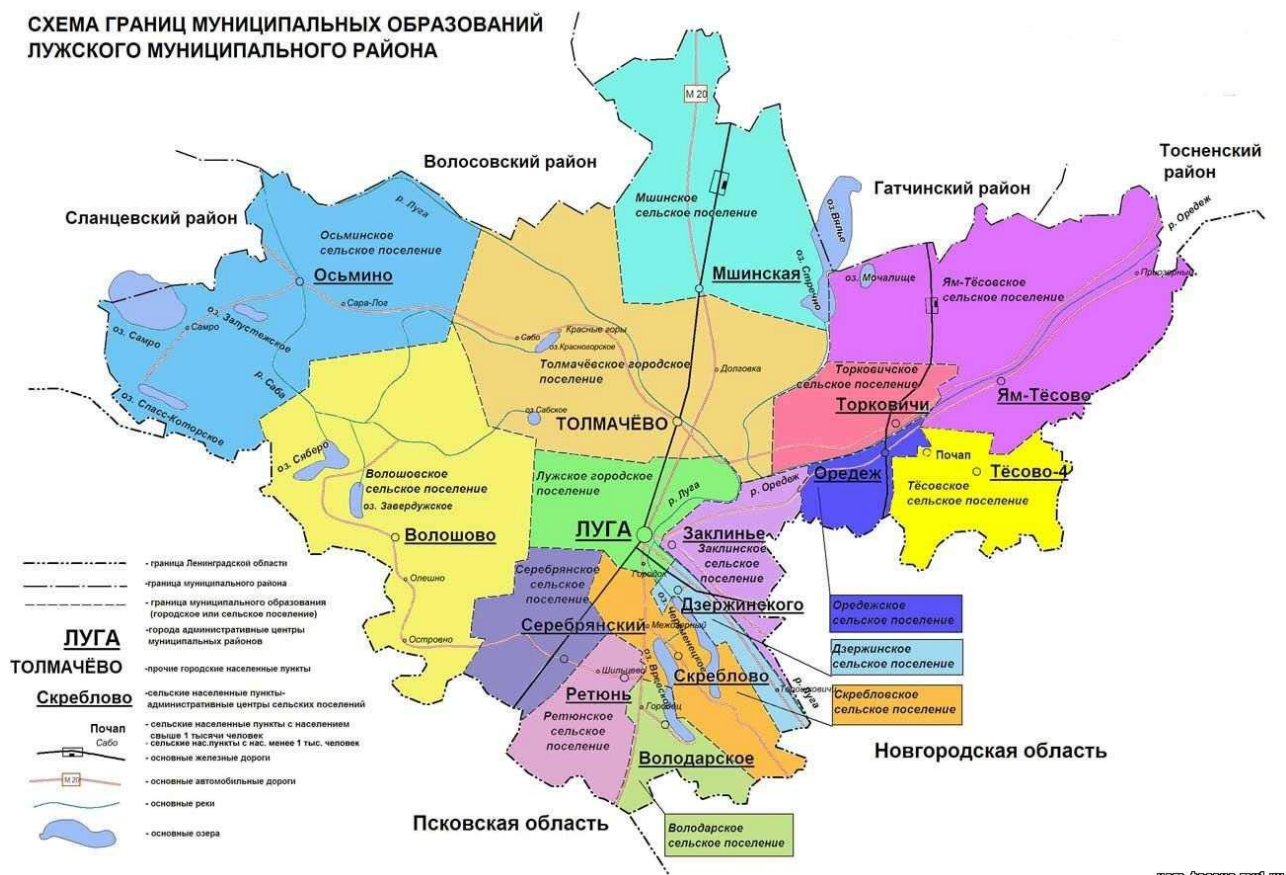
Рис. 1 Границы муниципальных образований Лужского муниципального района

Границы Серебрянского сельского поселения представлены на рис. 1.